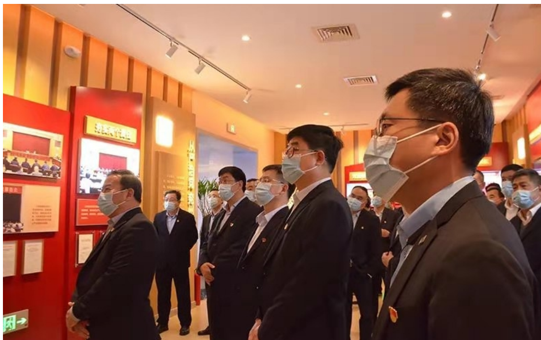
3月26日，化工公司纪委组织机关及权属单位党员干部赴兖州区廉政教育中心开展警示教育活动。