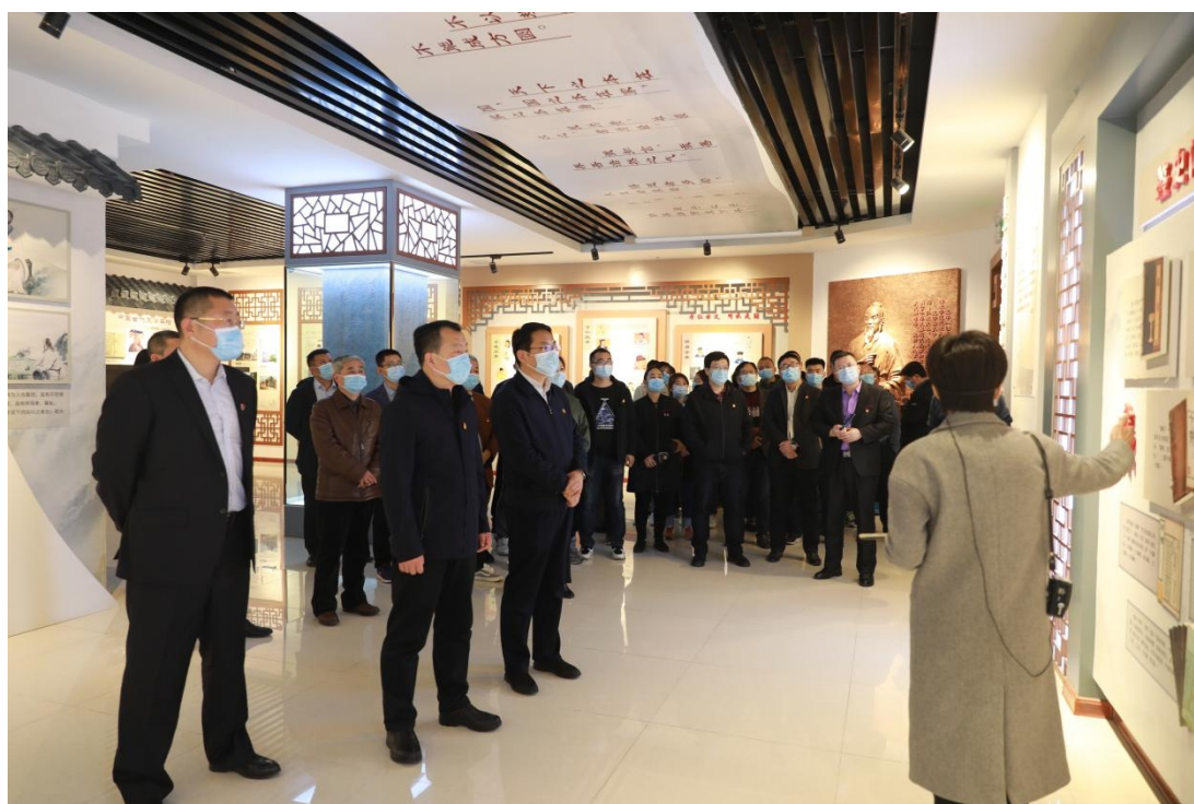
3月26日，轻合金公司纪委组织在家领导班子成员、副科级以上管理人员到邹城市廉政文化教育馆接受廉洁警示教育。