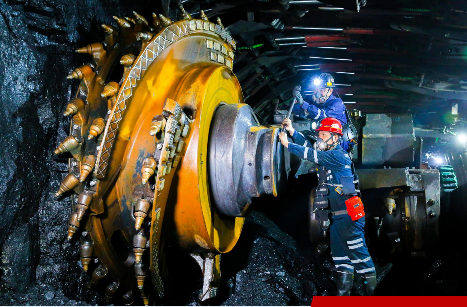
图为鲁西矿业采掘一线职工在井下作业。