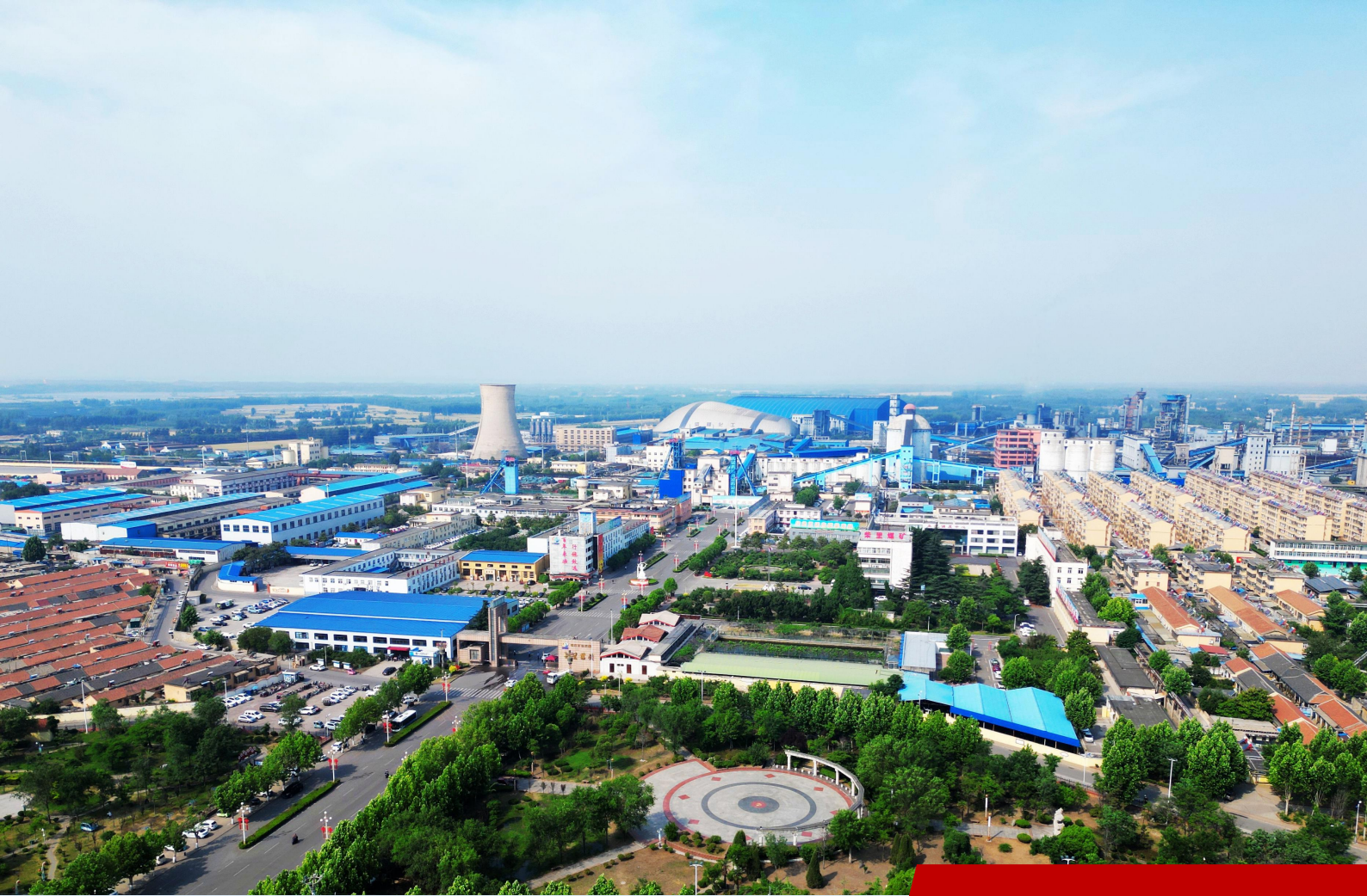
图为枣矿集团柴里煤矿鸟瞰。