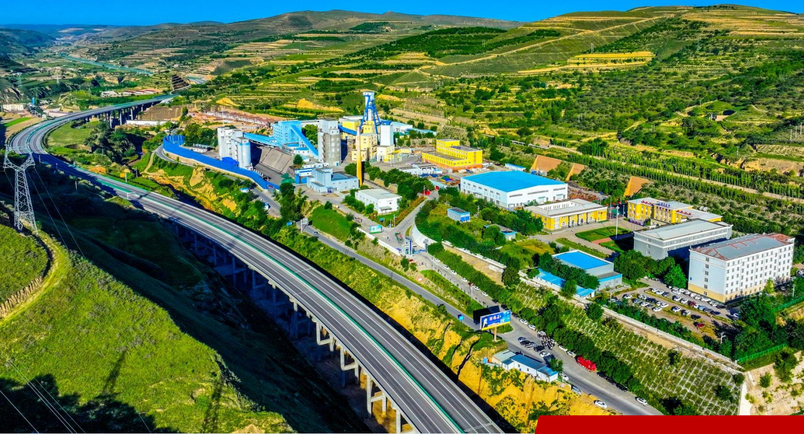
图为西北矿业刘园子煤矿秋景俯瞰。